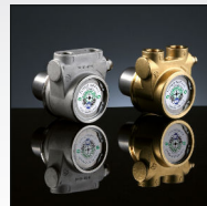
دارای ۲ پمپ مجزا