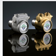
دارای ۲ پمپ مجزا