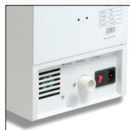
ورودی آب تصفیه