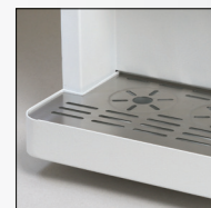
چکه گیر دستگاه