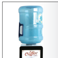
ورودی مخزن آب