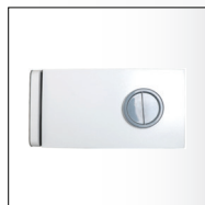
محل نصب مخزن آب