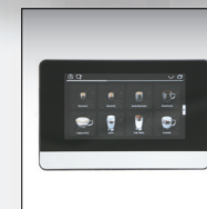
صفحه تمام لمسی