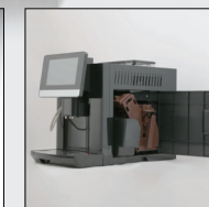
سبک و قابل حمل