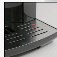
چکه گیر دستگاه