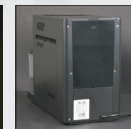
ورودی آب تصفیه