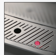
چکه گیر دستگاه